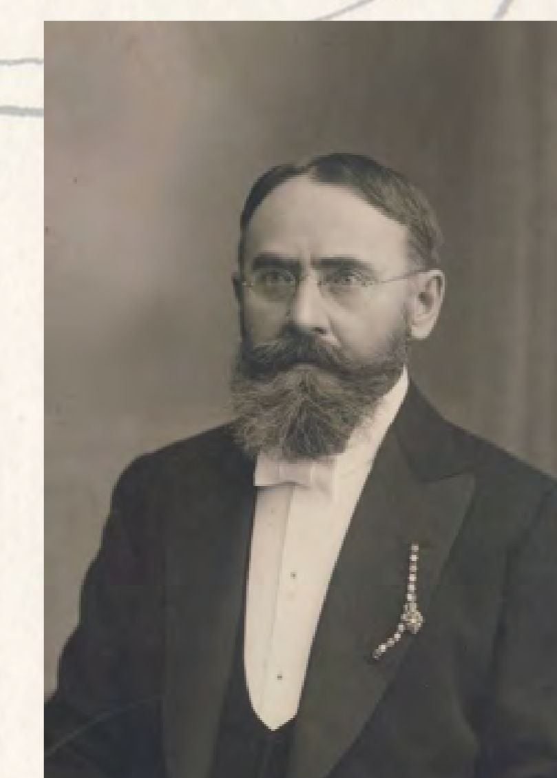
Fotografie Eduarda Langera z roku 1909.

Pro další osud Langerovy knihovny bylo rozhodující postátnění firmy Schroll v roce 1948–49, které se týkala i dalšího majetku včetně knihovny. Sbírkou převzala v roce 1949–1950 Národní kulturní komise, která ji přenesené i fakticky zlikvidovala – rukopisy, prvotisky i další staré a vzácné tisky včetně dokumentů archivní povahy byly převezeny do sběrného místa na zámek Sychrov, kde se soustředily sbírky zrušených a zabavených knihoven k dalšímu třídění. Knihy byly nabízeny různým knihovnám a institucím a ty, o které nebyl zájem, byly zničeny v papírně ve Štětí. Největší část tozra Langerovy knihovny, asi 6.000 svazků a část listkových katalogů, se dnes nachází ve fondu Knihovny Národního muzea v Praze. V KNAV se podle našich odhadů nalézá rádoev několik desítek tisků z Langerovy sbírky.